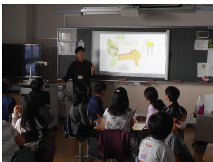
北区リサイクラー活動機構 出前授業の様子

この実験装置を使い同じ北区内の環境イベントにて実施しましたが大好評でした。次回環境展はもしできれば水素エンジン搭載のトラックの展示もやってみたいと研究室一同来年度に向けて張り切っております。最後に感想のお便りをくれた滝小6年生の皆さん本当に有難うございました。