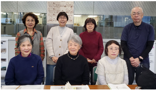
傾聴でつながるメンバー達

その中で「ゆるいつながりを大切にしていこう」が合言葉となり、何かあってもとりあえず笑顔でいきましょうとの思いで、会の名称は「えがお」に。