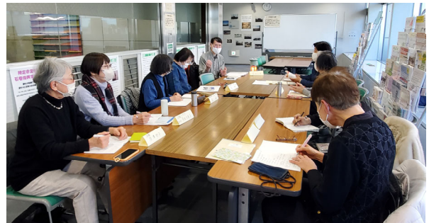
「つなgo」は貴重な情報交換の場

新団体として温かく迎えていただいたことも大変ありがたく、活動への安心感につながりました。