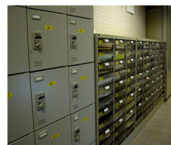
左:ロッカー 右:レターケース