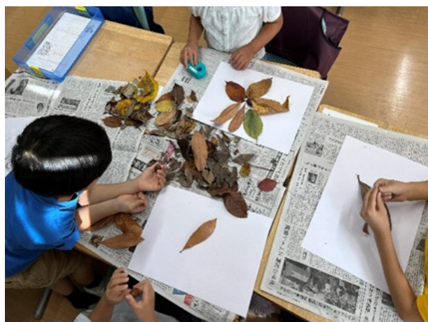
落葉の形を観察している風景

毎年行われる北区環境展では、「北区環境大学事業」を紹介するパネル展示と、小学生への出前授業を実施しています。今年の環境展では「はっぱであそぼう」をテーマにして、1年1、2、3組と5組の計4クラスで、落ち葉クラフトを楽しみました。授業の講師は東京家政大学の学生(3、4年生)が中心となり実施しました。児童には担任の先生を通じて「身の回りの落ち葉を拾ってくるように」伝えてありました。まずは落ち葉を観察します。大きさは？形は？色は？手触りは？そしてこれを、画用紙の上に並べ、張り付け、絵にしていきます。この