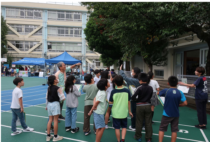
ソメイヨシノで樹木診断

木に実際にさわることは、今はほとんどありません。私たちは木と一緒に暮らしていて、友だち同士であることを、環境展を通して知ってもらえているのではと思っています。